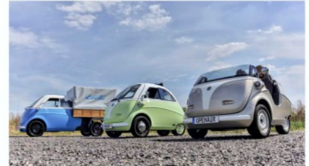
Die Vielfalt der vollelektrischen Evetta