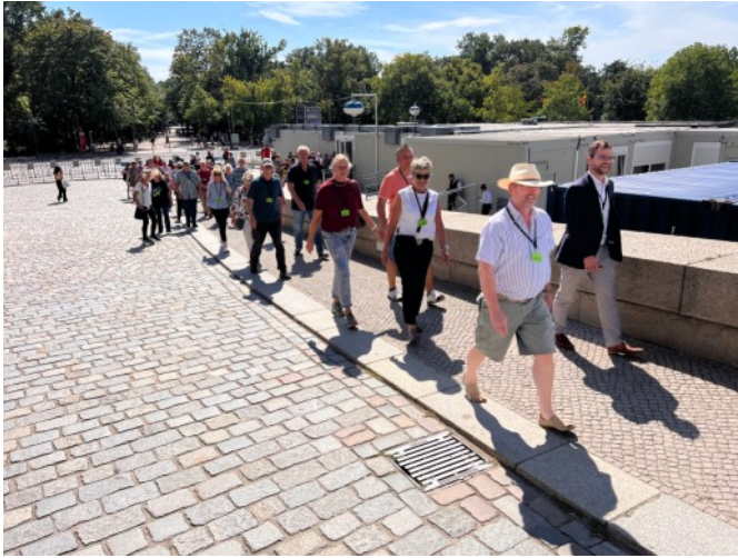
Auf dem Weg in den Reichstag