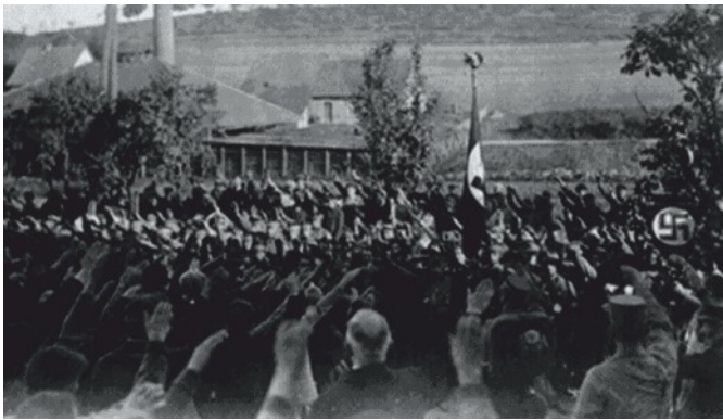
NSDAP-Veranstaltung in Fredelsloh

Eines ihrer deutschlandweit wahrscheinlich besten Ergebnisse erzielte Hitlers Partei in einem kleinen Dorf am Rande des Solling: In Fredelsloh wurden die Nazis mit 42,1 % und einer Stimme Vorsprung vor der SPD stärkste Partei. Für die „Northeimer Neueste Nachrichten“ war dieser „überraschende Erfolg“ der NSDAP in Fredelsloh „unbegreiflicher Weise“ erfolgt.