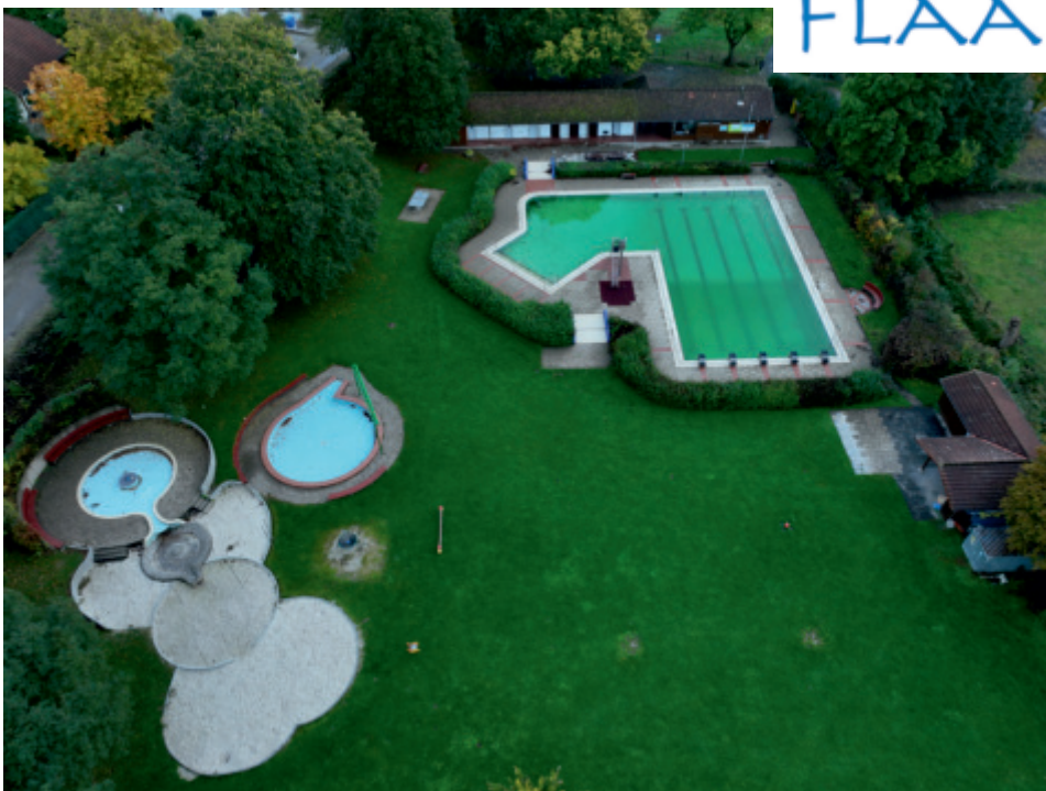
Luftaufnahmen vom Flaakebad