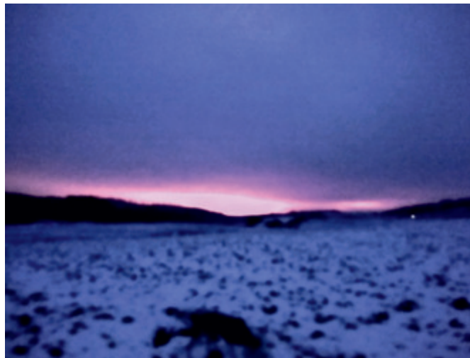
Rund um Fredelsloh im Dezember 2023