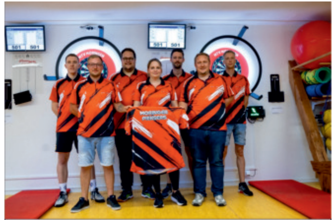
Ein Teil unserer Mannschaft bei der Präsentation der Trikots.