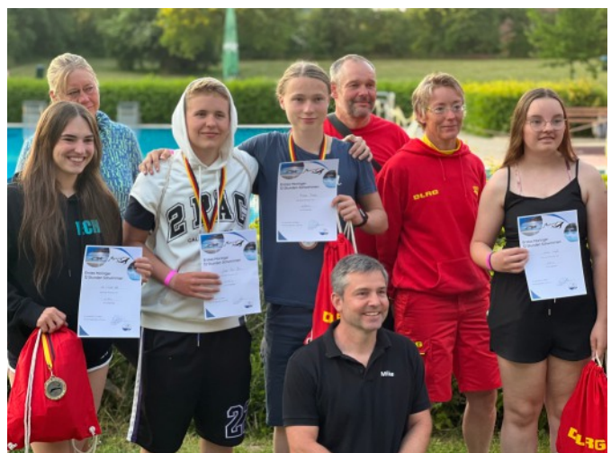
Preisverleihung mit Sachspenden vom REWE