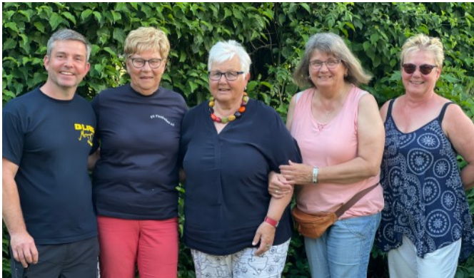
DLRG-Chef und Unterstützerinnen vom Förderverein