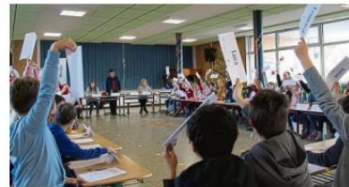
Wie bei einer Ratssitzung der Erwachsenen: Alle Kinder hatten Namensschilder vor sich auf ihrem Tisch, mit denen sie bei einer Abstimmung signalisierten, ob sie für oder gegen einen Antrag stimmten.

Die Vielfältigkeit der Anträge zeigte deutlich, wie intensiv sich die Grundschüler be-