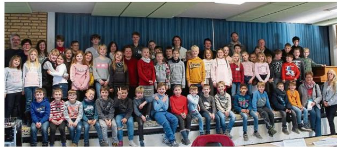
Nachwuchs-Kommunalpolitiker und Organisatoren: Das Projekt des Vereins „Politik zum Anfassen“ war in der Moringer Löwenzahnschule ein voller Erfolg. Mit viel Eifer waren alle bei der Sache.